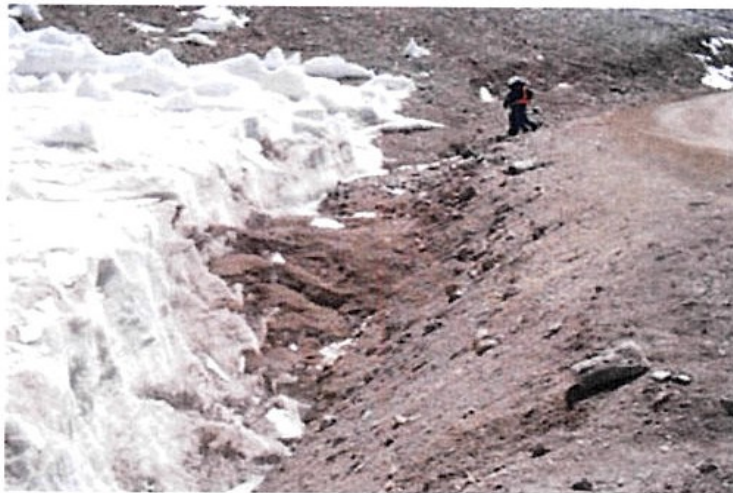
Sector del Glaciar Norte en su intersección con el camino