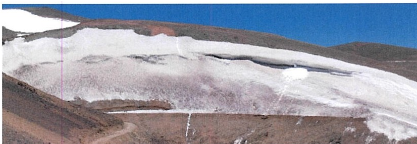
Glaciar Brown Inferior Desde Estación Fotográfica #1 (Dic. 8, 2003)

acumulación de polvo, acumulación de gravas del camino, alteraciones en los patrones de viento (...) El Glaciar Brown está actualmente separado en dos cuerpos de hielo”.