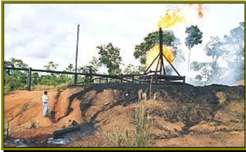
Derrames constantes de petróleo en los bosques de Ecuador.

En febrero del 2003, Amnesty International USA y Sierra Club, presentaron un nuevo informe titulado Environmentalists Under Fire: Six Urgent Cases of Human Rights Abuses 34 , (en el que la problemática ambiental del Ecuador es uno de los casos), se manifiesta: