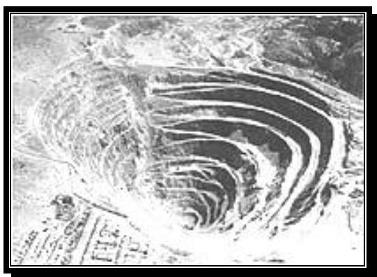
Degradación del suelo por explotación minera

En la ciudad de Esquel ubicada en la provincia de Neuquén, la concesión por parte del Estado provincial y posible explotación de una mina de oro a cargo de la multinacional MERIDIAN GOLD de Canadá, viene generando persecuciones y amenazas a los integrantes de las ONG's ambientalistas de la zona y vecinos de la comunidad de Esquel que se oponen a la explotación minera.