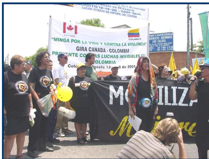
Manifestación contra las persecuciones a defensores de los derechos humanos