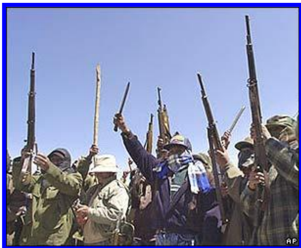
Campesinos e indígenas que participaron de los Choques con las fuerzas de seguridad

de Cochabamba otorgada a Aguas del Tunari , subsidiaria local de la transnacional Bechtel Corp. con base en California (USA).