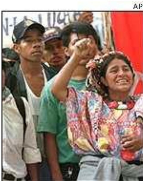
Reclamo de indígenas frente a las explotaciones mineras y de petróleo.

Las mujeres e hijos abandonados, sufren además la agresión de parte de los guardianes de la compañía , quienes están procediendo al desalojo, limitándoles el acceso a su antigua propiedad o posesión, situación que evidencia el total desamparo, y la desintegración familiar.