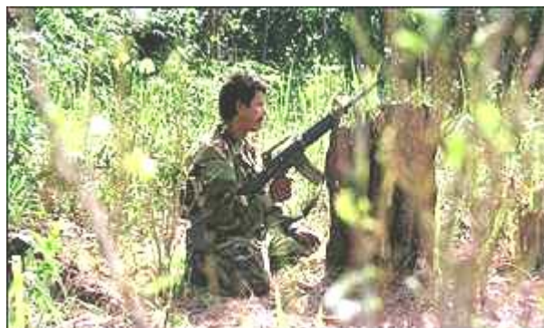
Paramilitar armado en la zona de conflicto