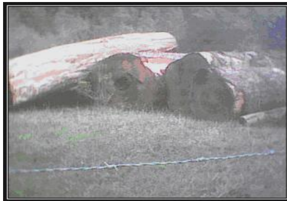
Tala indiscriminada del bosque nativo chileno

iniciativa procuraron en su campaña, no solamente denunciar los daños ambientales y la destrucción del bosque nativo, sino también dar a conocer la situación que enfrentan los Mapuches y sus comunidades ante los serios daños a su ecosistema, como si también, los graves conflictos políticos, judiciales y policiales que enfrentan como consecuencia de las serias disputas territoriales con empresas forestales, como MININCO y ARAUCO .