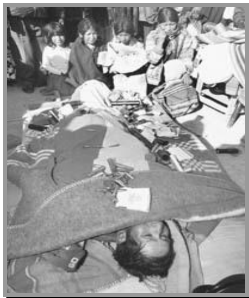
bolivianos lloran los muertos campesinos por el conflicto del gas