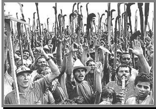
Fundación Auna. 2000 Colabora Eastman Kodak Company

En un informe recientemente presentado, titulado “ Estado de Conflicto ”, la organización Greenpeace denunció la situación del estado amazónico brasileño de Pará, donde las actividades forestales y los ranchos para el ganado son las principales fuerzas destructoras detrás de la ocupación ilegal de las tierras. “Como en muchas otras zonas del Amazona, los problemas ambientales en Pará están frecuentemente asociados a situaciones de injusticia social. Pará es el estado brasileño con mayor índice de asesinatos relacionados con conflictos por la propiedad de la tierra, los que rara vez son investigados” , sostuvo en su informe la organización ecologista. 17