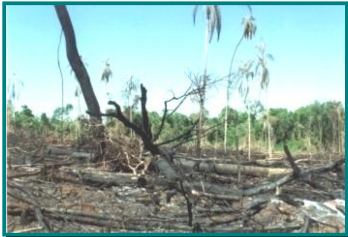
Depredación y quema del bosque por parte de empresas forestales

varias especies de plantas y animales en peligro de extinción. 37 Ya en su momento el ex presidente Gustavo Noboa, afirmaba que le “ declararía la guerra ” a los ambientalistas y que lucharía contra los críticos del proyecto “ trinchera por trinchera ” para asegurarse de que el oleoducto esté funcionando para julio de 2003. El actual gobierno del Presidente Lucio Gutiérrez no ha detenido las obras por lo que los conflictos con las comunidades indígenas están aumentando.