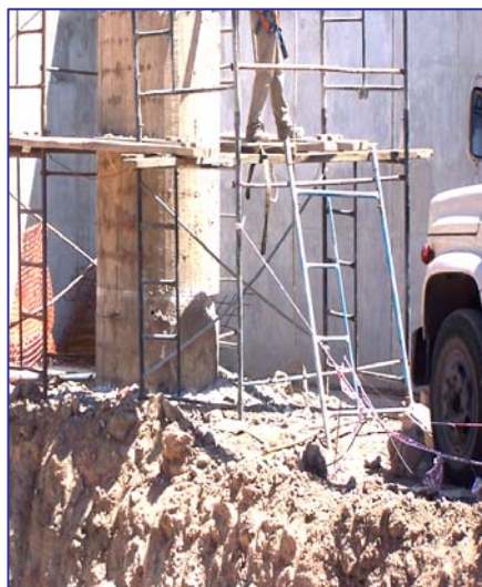
Trabajos de reestructuración y en la planta EDAR Bajo Grande.

aproximadamente, e instaló un tanque cisterna y una bomba neumática que permitirá prestar el servicio en forma adecuada.