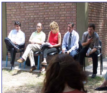
Reunión de la comisión ad hoc.