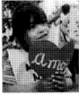
Precautionary measure in favour of the health of children.

After the Defence Counsel of the Superior Court of Justice (STJ), Arsenio Mendoza, requested that the Family, Civil and Criminal Court of Minors in Gualeguaychú should adopt urgent measures to protect the health and life of children in the city, due to the environmental contamination and the carcinogenic substances to which they would be exposed if the papermills are located in Fray Bentos, Judge Domingo Vassalo, in charge of the Minors Court, last Saturday passed a precautionary and preventive measure which is directly related to the possible environmental damage caused by the papermills.