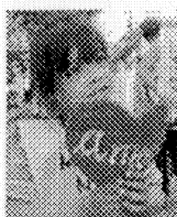
Medida cautelar a favor de la salud de los niños.